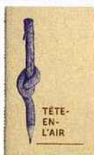
CARNET DE NOTES, collection «Crayonné», Les Editions du Paon, 9 €.