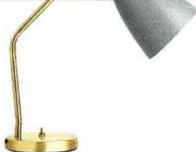
LAMPE ORIENTABLE «Grashoppa Task» en acier et laiton, Gubi, à partir de 400 €.